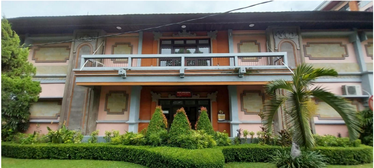
Gambar 9. Studio "I Wayan Berata"