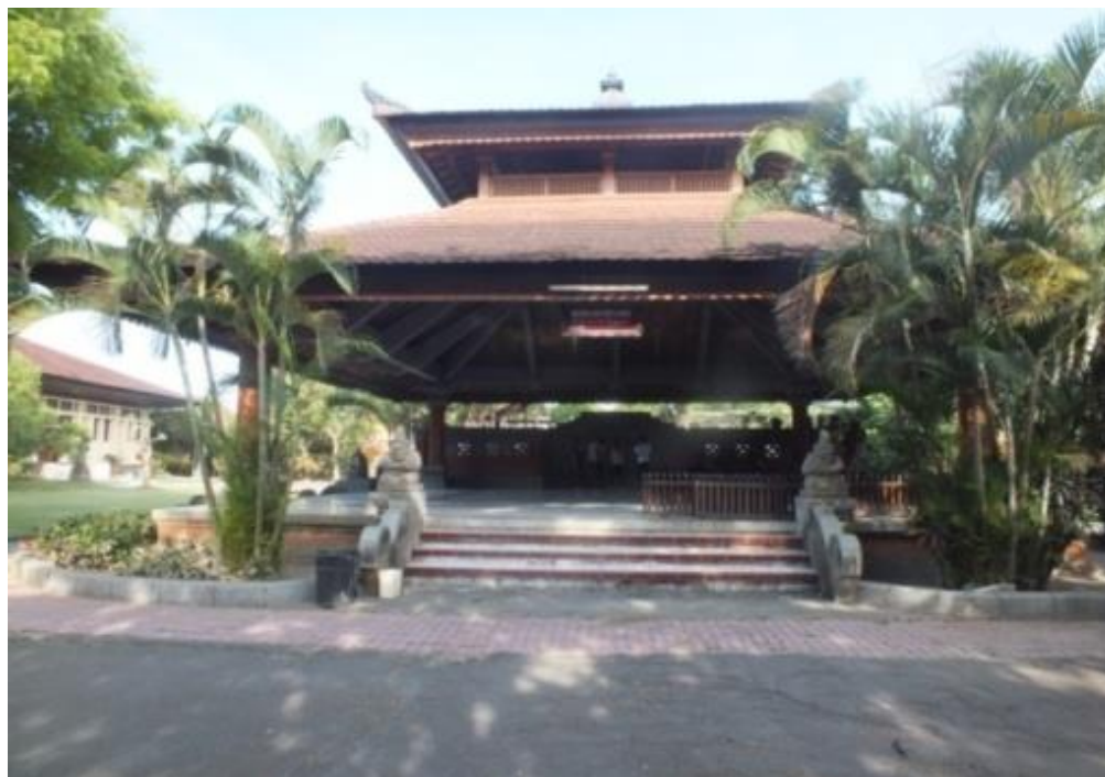
Gambar 4. Gedung Wantilan Loka Widya Sabha untuk kegiatan umum