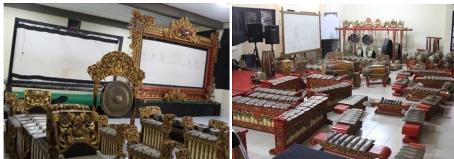
Gambar 8. Sarana Praktik Prodi Pedalangan