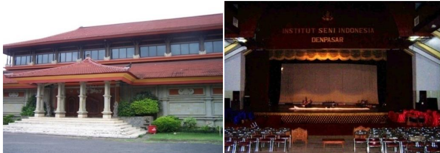
Gambar 5. Panggung Natya Mandala