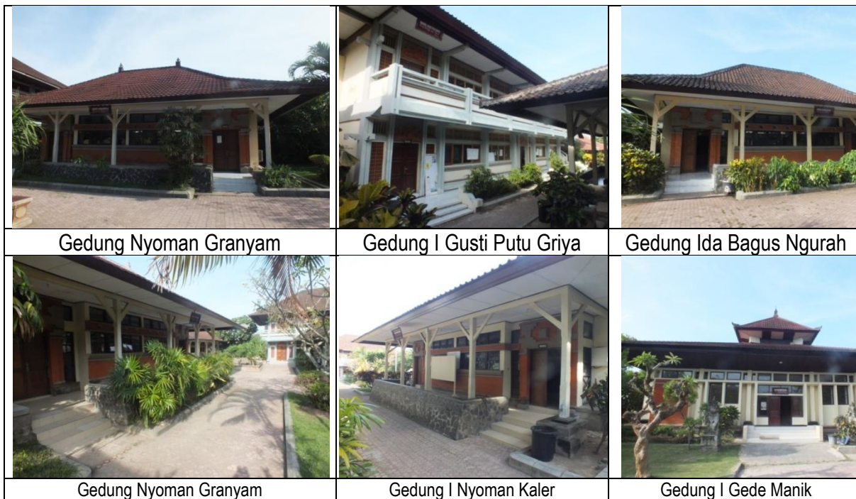
Gambar 3. Gedung tempat perkuliahan seluruh Prodi di FSP