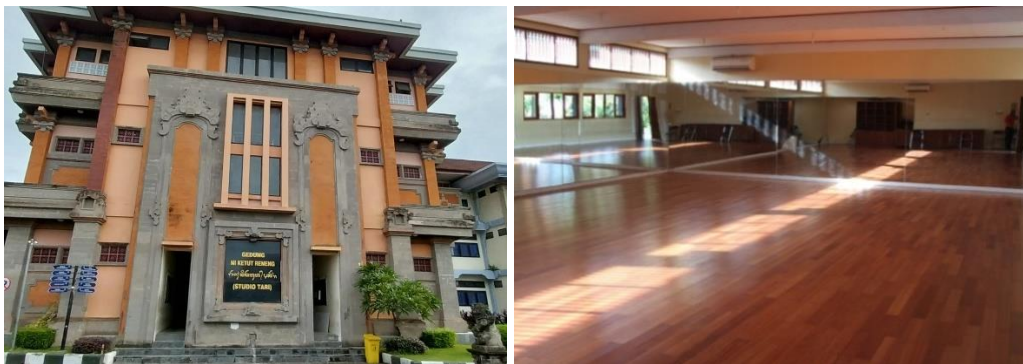
Gambar 11. Gedung Studio Tari "Ni Ketut Reneng"