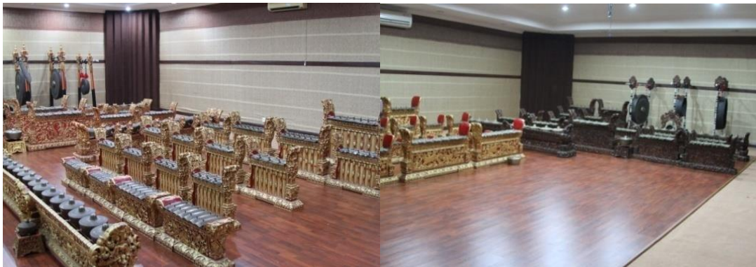
Gambar 10. Sarana Praktik Prodi Karawitan di Studio "I Wayan Berata"