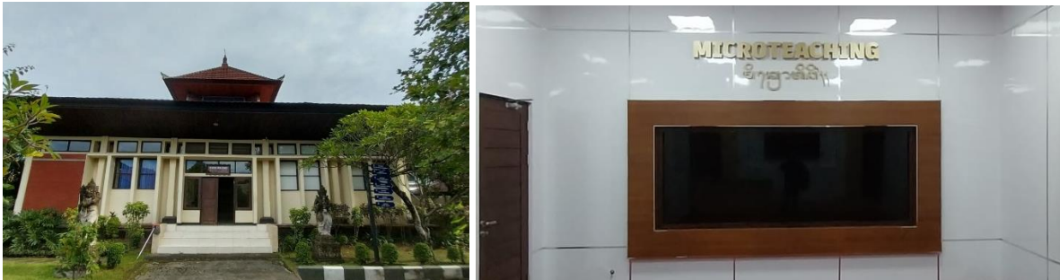
Gambar 12. Gedung Gde Manik dan Lab. Micro Teaching Prodi Pendidikan Seni Pertunjukan