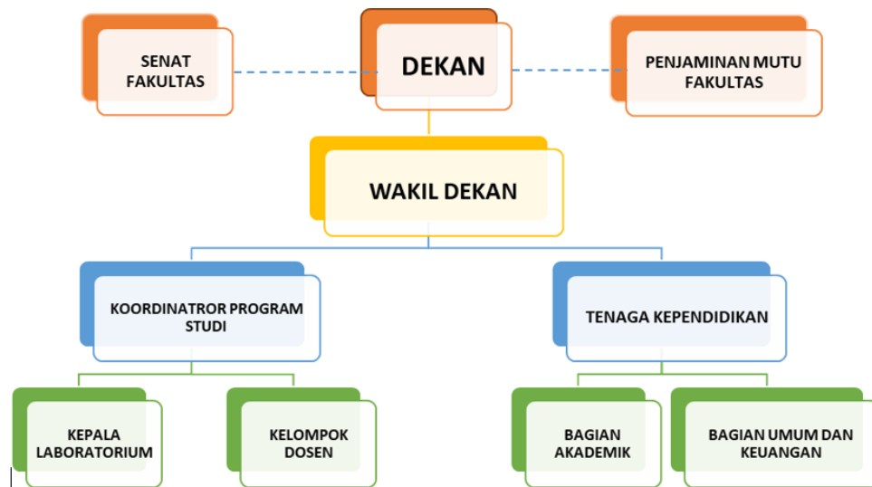
Gambar 1. Struktur Organisasi Fakultas Seni Pertunjukan