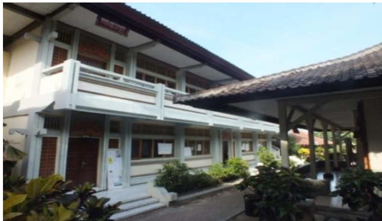
Gambar 7. Studio Pedalangan