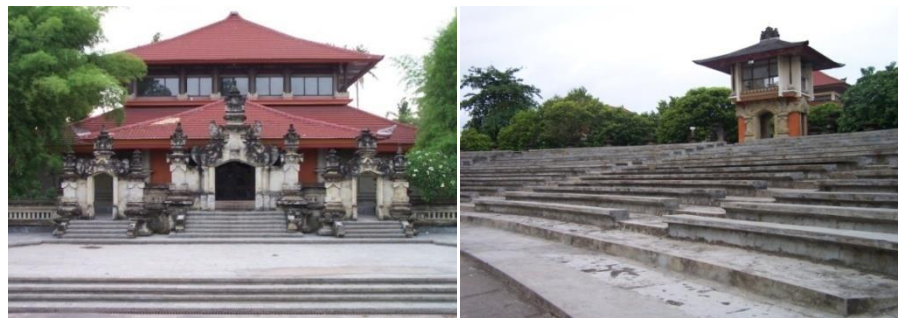
Gambar 6. Panggung Terbuka "Nretya Mandala" ISI Denpasar