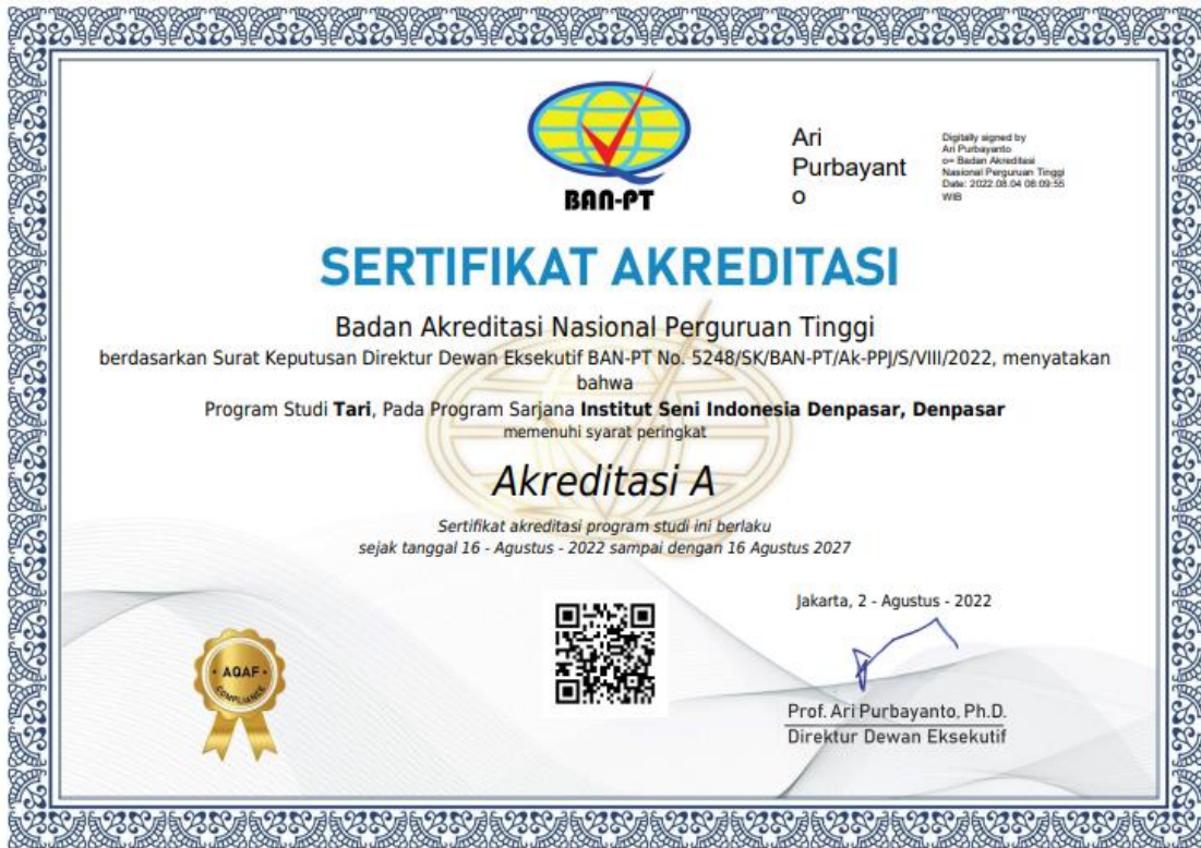
Lampiran 2. Sertifikat Akreditasi Seluruh Program Studi di Fakultas Seni Pertunjukan