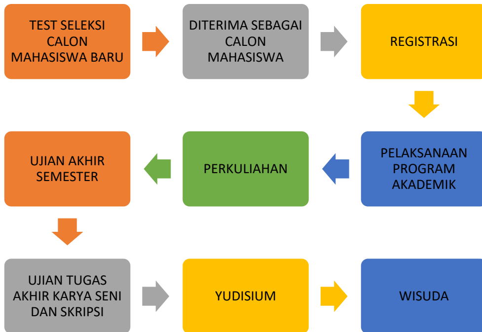
Gambar 13. Siklus Kegiatan Administrasi Akademik

Proses administrasi akademik mencakup kegiatan-kegiatan sebagai berikut (1) Seleksi Penerimaan Mahasiswa Baru; (2) Registrasi/Her Registrasi (3) Pelaksanaan Program Akademik; (4) Perkuliahan; (5) Ujian Akhir Semester, (6) Tugas Akhir; (7) Ujian Akhir; 8 Yudisium; dan (9) Wisuda;