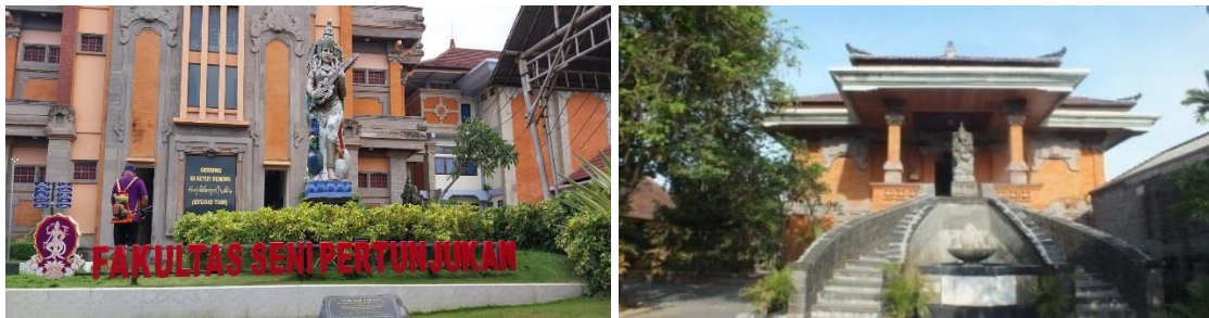
Gambar 2. Gedung Fakultas Seni Pertunjukan

Fakultas Seni Pertunjukan merupakan bagian dari Institut Seni Indonesia Denpasar yang terletak di Jalan Nusa Indah Denpasar. Secara keseluruhan kampus ISI Denpasar berdiri di atas tanah seluas 47.853 M2 dan Fakultas Seni Pertunjukan berlokasi pada areal sebelah utara. Untuk mendukung kelancaran proses pembelajaran Fakultas Seni Pertunjukan dilengkapi dengan berbagai fasilitas seperti ruang kuliah, laboratorium/studio, perpustakaan dan sarana pendidikan lainnya yang cukup memadai. Sebagai lembaga pendidikan seni FSP ISI Denpasar memiliki berbagai sarana penunjang pembelajaran untuk praktikum seperti alat musik tradisional dan moderen, busana tari, beberapa jenis wayang, fasilitas yang cukup representatif seperti: Ruang Kuliah Gde Manik, Ruang Kuliah Ida Bagus Ngurah, Ruang Kuliah Geruh, Ruang Kuliah/Studio PSP I Nyoman Granyam, Stage Natya Mandala, Studio Tari Ni Ketut Reneng, Lab Bahasa, Stage Candra Metu, Nretya Mandala, Ruang Micro Teaching Wayan Madra, Studio Karawitan I Wayan Berata, Wantilan Loka Widya Sabha, Gedung Lila Sanggraha, Ruang Drum, Ruang Sexo, Ruang Cello, dan juga fasilitas-fasilitas yang berkaitan dengan kompetensi tambahan seperti Studio tata Rias Busana, Studio Rekam, Bengkel Perapen, Ruang Multimedia, TIK, Archive, Pusdok Latta Mahosadhi.